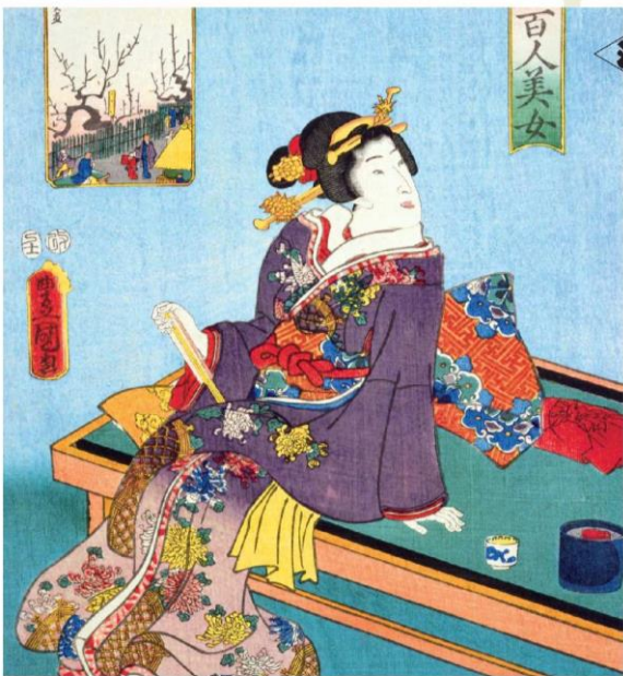
国立国会図書館蔵 江戸名所百人美女 梅やしき