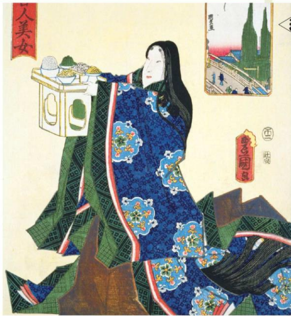
国立国会図書館蔵 江戸名所百人美女 京ばし