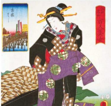
江戸名所百人美女 両国はし

江戸の町は活気に溢れて明るく、女性は生き生きと暮らし、おおらかでつつしみ深かったといえます。自立している女性は「江戸小町」と呼ばれ、小意気、小ざれい、小じっかりがその要素。また、江戸美人の条件は、容姿ではなく自分の努力で身につけた「ゆかしい」雰囲気を持っていること。しぐさを磨くのはもちろん、おしやれは着物の裏地や襟、足袋のコハゼなどに工夫を凝らしたそうです。控えめで奥ゆかしく、愛嬌が伴っている素敵な女性は、今も昔も人の心を引きつけます。